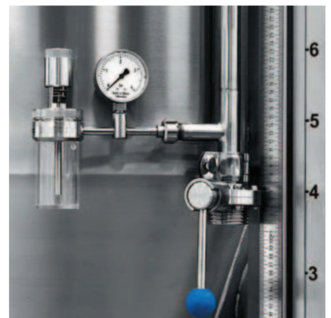
ASTA GRADUATA DI LIVELLO ESTERNO FISCALE CON GORGOLIATORE. EXTERNAL LEVEL GAUGE WITH BUBBLER.