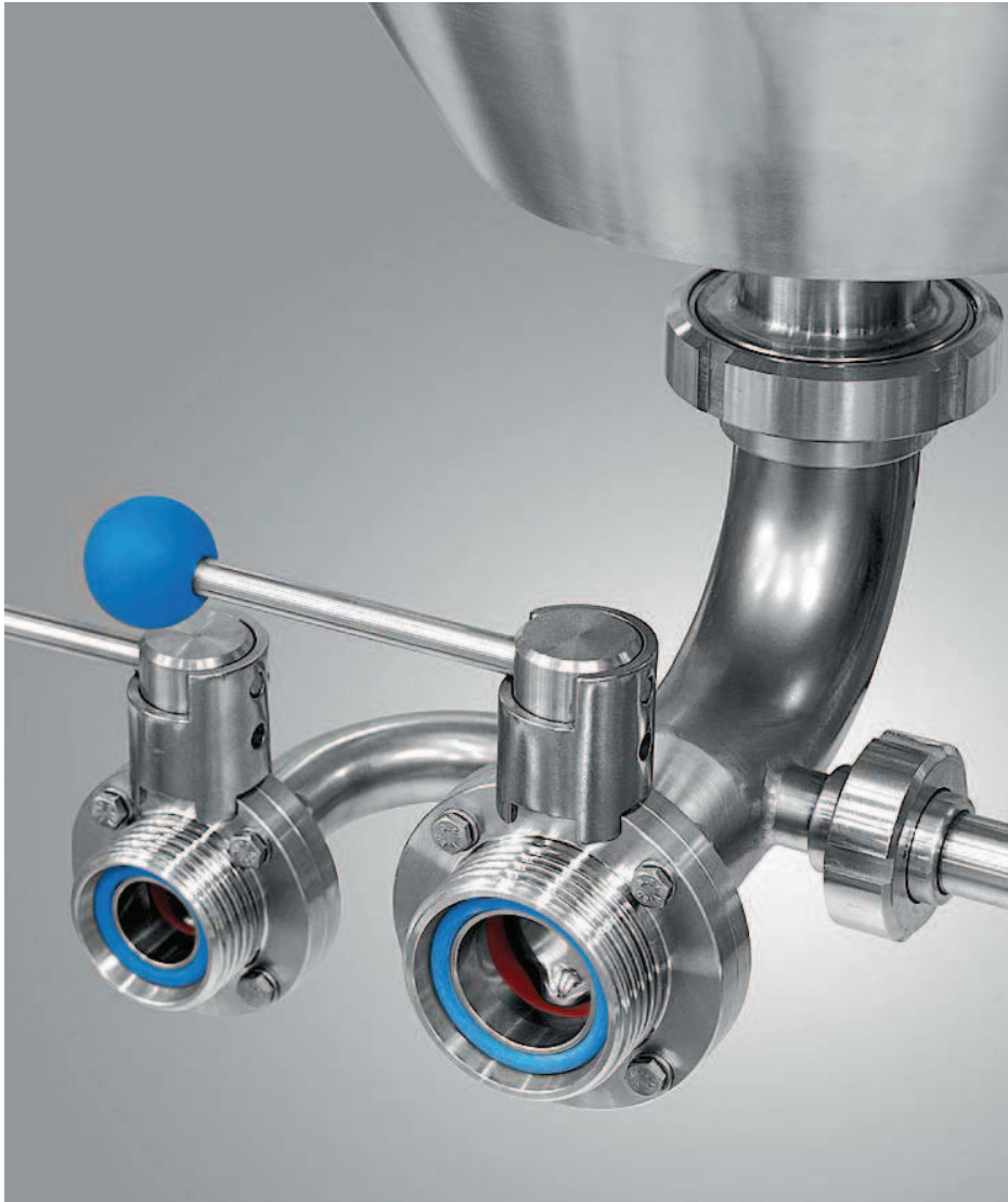
DOPPIO SCARICO MOSTO [PARZIALE E TOTALE]. DOUBLE WORT DISCHARGE OUTLET [PARTIAL AND TOTAL].