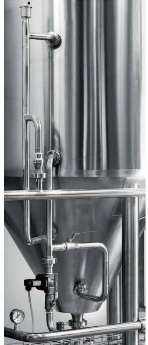
COLLEGAMENTI CIRCUITO H 2 O GELIDA IN ACCIAIO INOX. STAINLESS STEEL FREEZING H 2 O CIRCUIT CONNECTION.