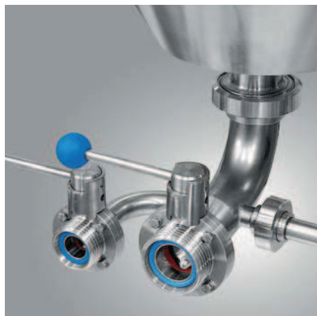
DOPPIO SCARICO MOSTO [PARZIALE E TOTALE]. DOUBLE WORT DISCHARGE OUTLET [PARTIAL AND TOTAL].